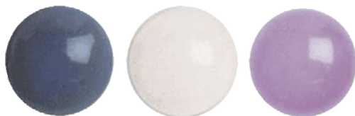
Verunreinigungen vor und nach der Reinigung. Links: mit blauem Farbstoff sichtbar gemachte Verunreinigungen. Rechts: Mit üblichem Handelsprodukt gereinigte Linse. Mitte: Mit Lösung „Reinigen R“ behandelte Linse 1 .

Contopharma „Reinigen R“ ist das Resultat einer längeren Entwicklung 1 auf der Suche nach einer nicht abrasiven (zur Schonung der Linsen), tensidhaltigen Formulierung mit hoher Reinigungskraft ohne übermässige Reizungen bei direktem Augenkontakt. Contopharma „Reinigen R“ ist frei von schwermetallhaltigen Desinfektionsstoffen.