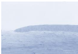
Reguläre Wundheilung unter „lid & lens“

In einem Modell der Wundheilung von Hornhaut-epithel 1,3 , in dem wir bereits früher eine Reihe von Contactlinsen-Pflegemitteln als teilweise epithelfeindlich gefunden hatten 2 , zeigte die Lösung „lid & lens“ keine Hemmung der epithelialen Wundheilung 4 . Somit ist eine normale Regenerationsmöglichkeit der beim Contactlinsenträger immer wieder vorkommenden Mikroläsionen des Hornhaut-epithels möglich.